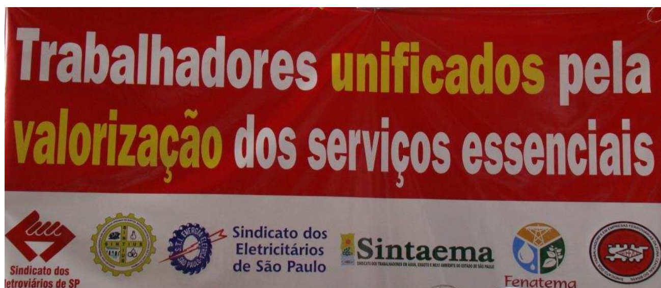
Entidades se uniram em prol dos trabalhadores.