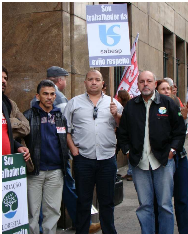
Dirigentes do SintiUS participaram da manifestação.

SEDE PRÓPRIA: Rua São Paulo, 24/26 - Vila Belmiro - CEP: 11.075-330 - Santos – SP