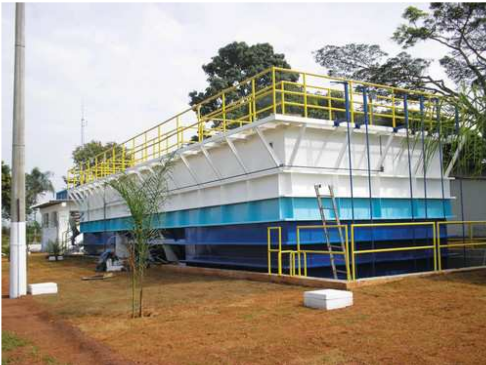
Marginais armados invadiram e assaltaram funcionários da ETA- 3.

O sindicato entrou em contato com a Sabesp e a empresa se comprometeu a adotar medidas complementares para reforçar a questão da segurança para todas as unidades das estações de tratamento.