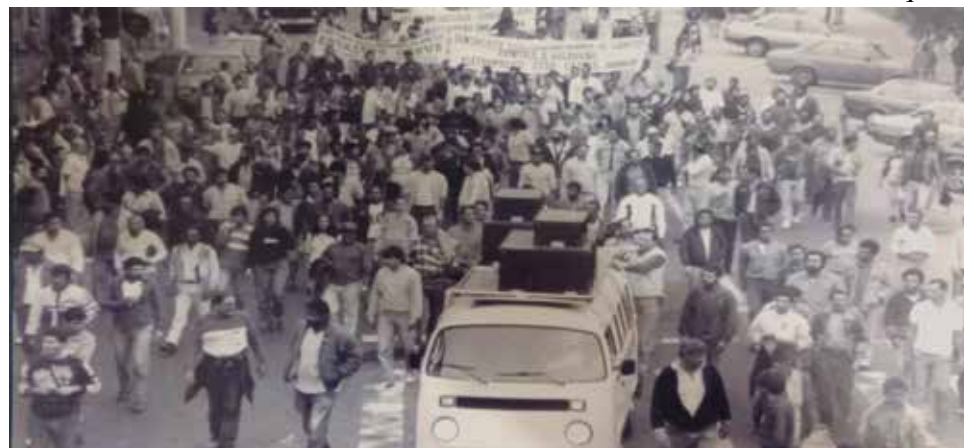
Sintius participou da greve geral em solidariedade aos portuários demitidos, em 1991