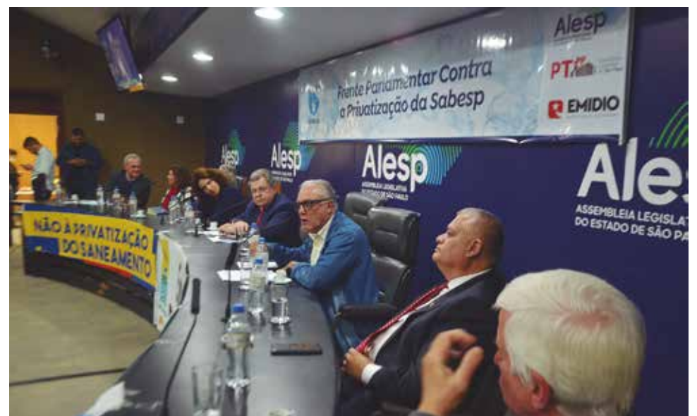
Sintius reforçou a importância da Sabesp como uma empresa pública