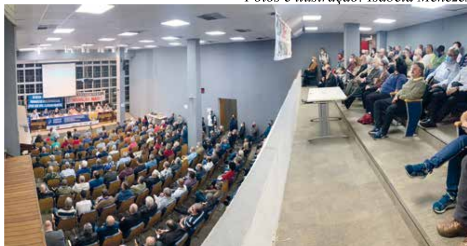
Diretoria do Sintius participou do evento realizado no dia 6 de junho

No dia 30 de maio, a Previc (Superintendência Nacional de Previdência Complementar) comunicou à Vivest a decisão de suspender o processo de retirada total de patrocínio do Plano de Suplementação de Aposentadorias e Pensões (PSAP/Eletropaulo), após várias denúncias de irregularidades feitas pelas entidades. Essa medida foi tomada até que o órgão conclua os processos administrativos existentes sobre esse assunto que estão em andamento.