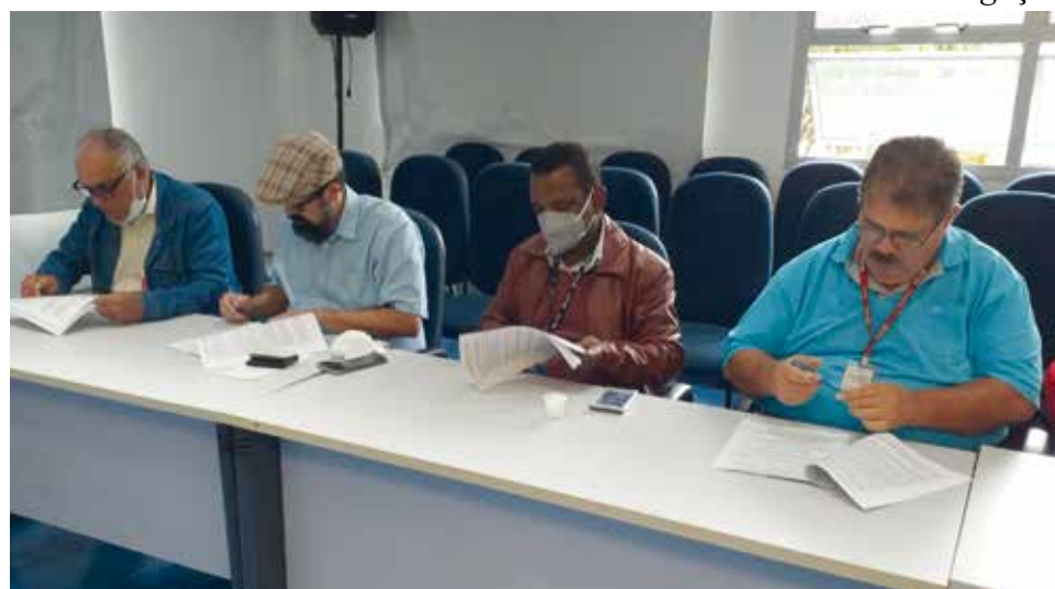
O novo ACT e o acordo da PPR 2022 foram assinados no dia 1º de junho

de fato, ocorreu no dia 1º de junho. Cetesb, já que o acordo relacionado