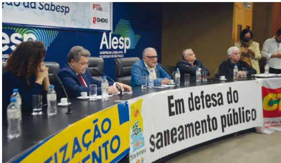
A Diretoria do Sintius se manifestou durante o lançamento da frente parlamentar

interesse do mercado por ser muito lucrativa. No ano passado, a Sabesp obte-