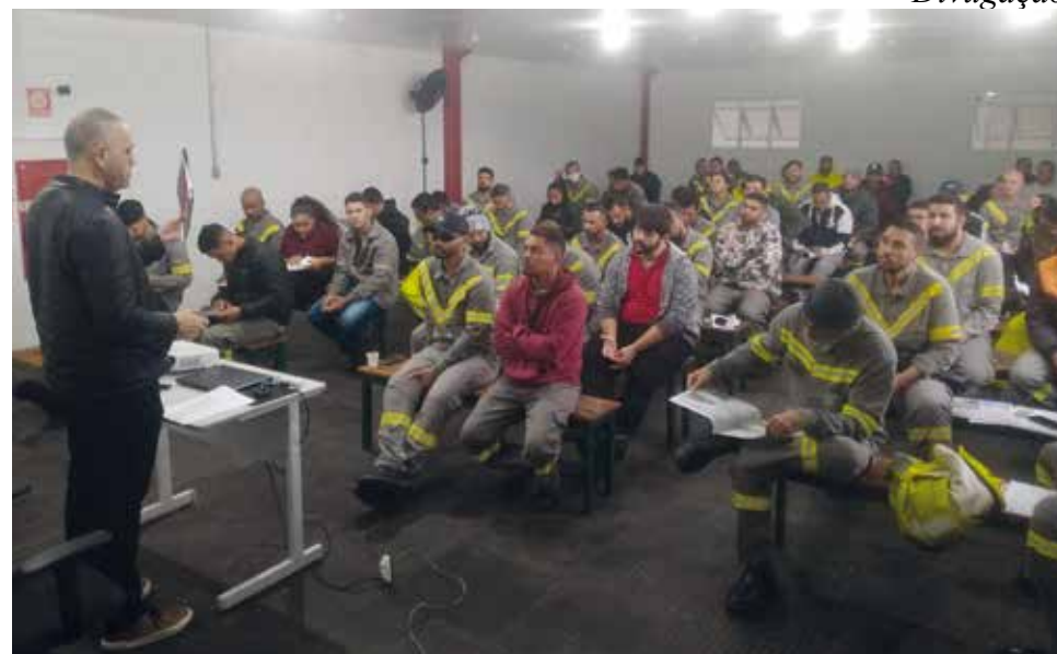
A reunião virtual com os representantes da empresa ocorreu no dia 16 de março

Na política de emprego, o Sindicato defende que a B. Tobace reduza a cláusula de rotatividade de pessoal de 3,5% para 2,5% e ofereça a atualização dos cursos NRs 10 e 35.