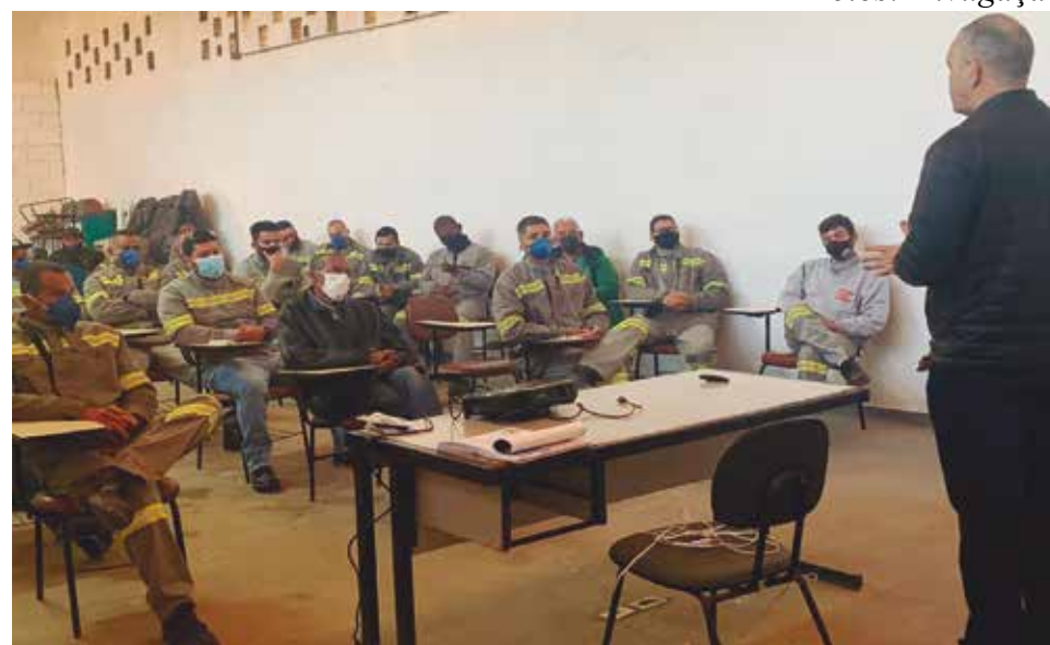
A assembleia ocorreu na unidade da empresa, em Praia Grande

A categoria defende que o novo Acordo Coletivo de Trabalho (ACT) estabeleça um reajuste salarial de 11,73% (índice da inflação acumulada nos últimos 12 meses, segundo o IPCA), mais aumento real nos vencimentos, bem como no vale-alimentação e no vale-refeição.