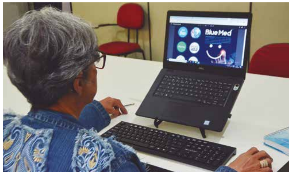
Jupira está no Sintius às segundas e quartas-feiras, das 9h às 16h30