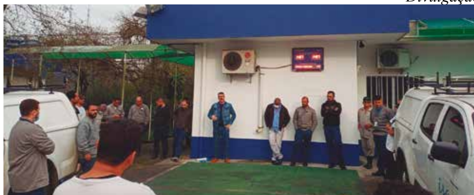
Os companheiros foram atualizados sobre algumas ações do Sindicato

Na oportunidade, foi comentado também sobre a ação judicial do Sindicato para a manutenção do pagamento de refeição de almoço quando o trabalhador desenvolve atividades fora da sua localidade, que foi suspenso em abril de 2020, justamente no início da