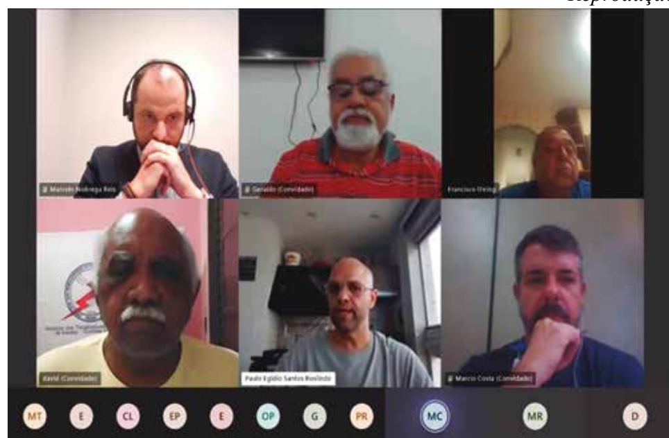
A reunião virtual com os representantes da empresa ocorreu no dia 5 de julho

proposta reposição inflacionária para a parte fixa da PLR, nem menciona aumento real a salários e benefícios, espe-