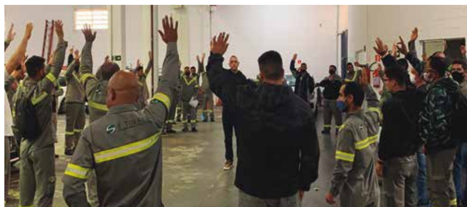
B. Tobace quis corrigir os salários em apenas 8%, em junho

Diante disso, a Diretoria do Sintius solicitou, de imediato, uma reunião com os representantes da empresa para dialogar a respeito do ACT e negociar avanços que contemplem os anseios da categoria.