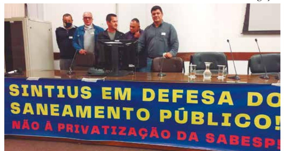
O evento no Parlamento paulistano ocorreu na noite do dia 20 de junho

O Sindicato também tem alertado que as autoridades sobre os eventuais prejuízos à população, caso a privatização da empresa seja concretizada, como a queda na qualidade do serviço e o aumento das tarifas.