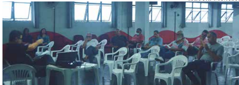
A assembleia fez a discussão sobre o orçamento de 2023 no dia 29 de novembro