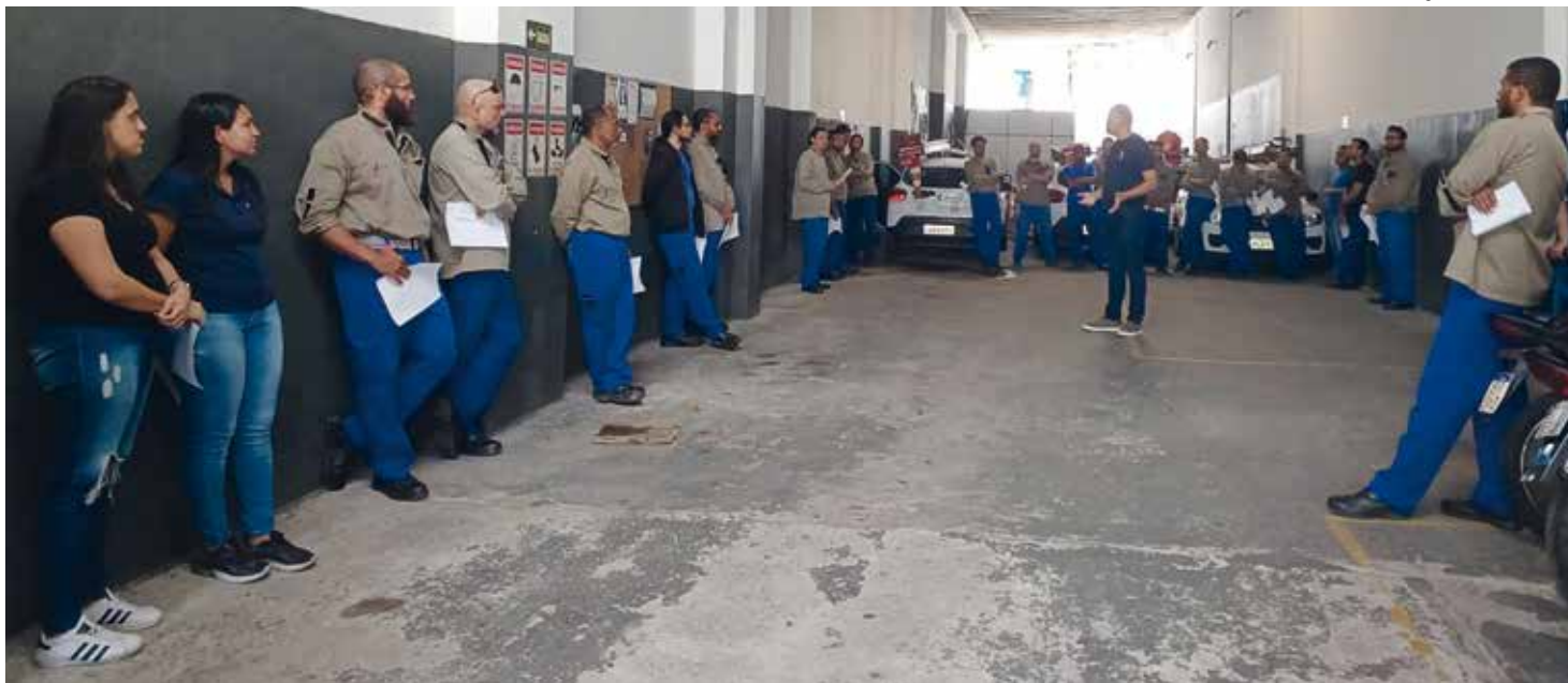
Diretoria do Sintius está dialogando com os trabalhadores sobre a formulação da pauta de reivindicações à empresa

A Diretoria do Sindicato estará analisando qual instrumento será utilizado para a correção dos salários e benefícios dos trabalhadores. A pauta de reivindicações já está sendo construída com a categoria. Ain-