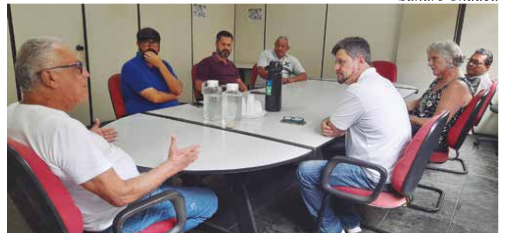
Diretores do Sintius e do Sintaema alinham ações tendo em vista as lutas de 2023

Em audiência no MPT, Sintius defende plano de saúde de aposentados por invalidez P. 4