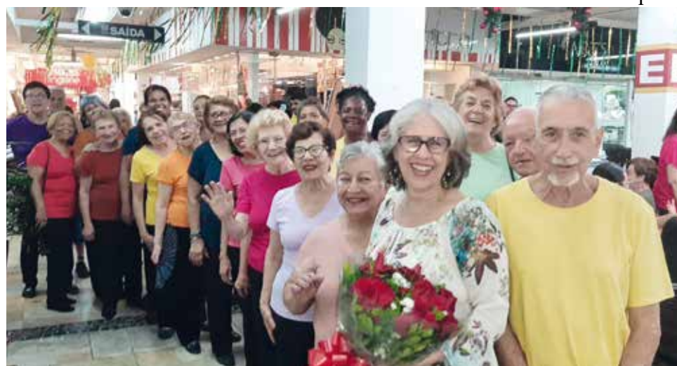
O grupo se apresentou no início deste mês no Super Centro Boqueirão