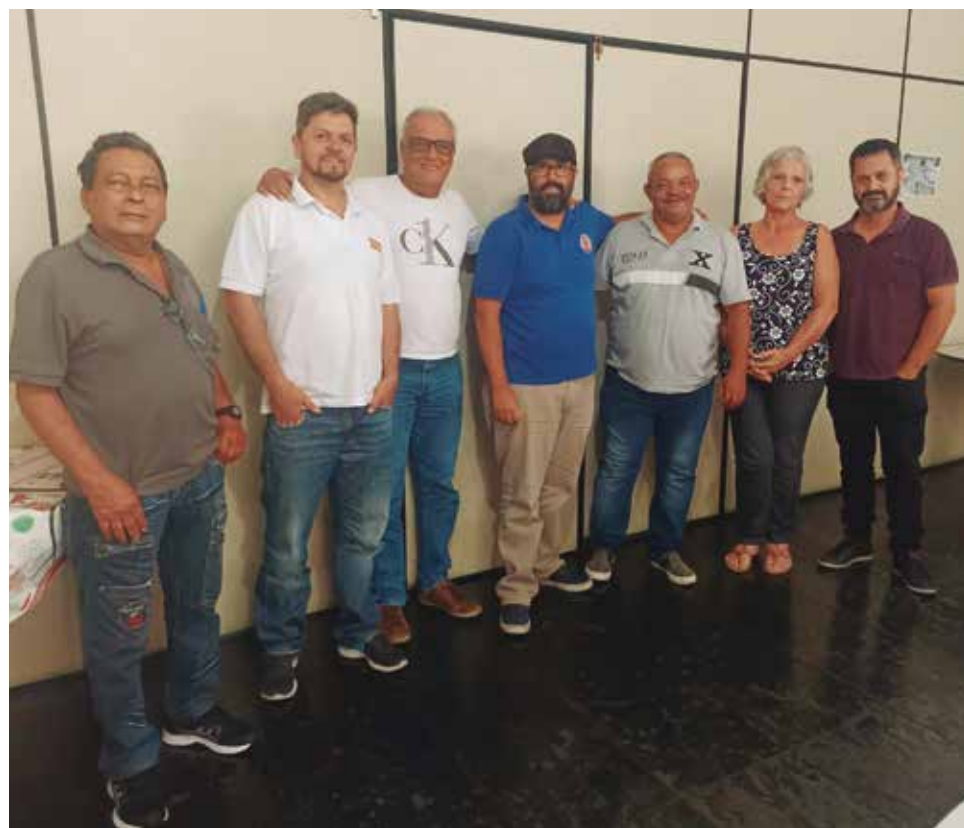
A luta contra a privatização da Sabesp deverá envolver outras categorias

(ACT) da Sabesp não será fácil, devido aos perfis do futuro governador e dos secretários já anunciados. Portanto, é fundamental que haja esse espírito de unidade. Em janeiro,